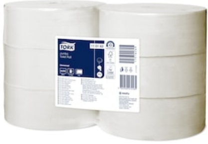
Tork Jumbo TR Uni 1p 500m 110162