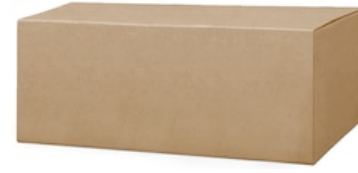
Jumbo TR Neut 2p 380m 64020