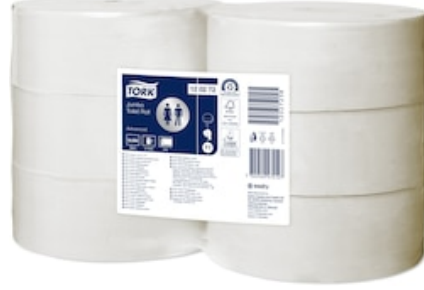
Tork Jumbo TR Adv 2p 360m 120272