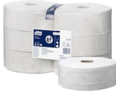
Tork Jumbo TR Adv 2p 380m 472118